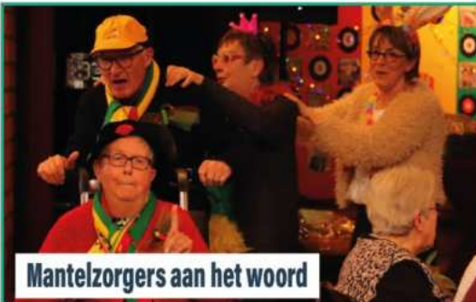
Mantelzorgers aan het woord