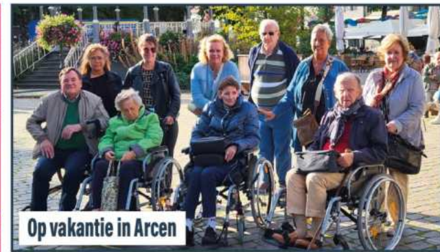
Op vakantie in Arcen