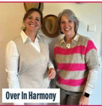
Over In Harmony